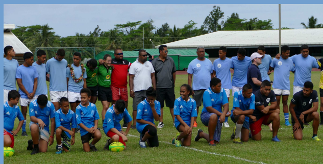
9ème édition du tournoi de Rugby à 7