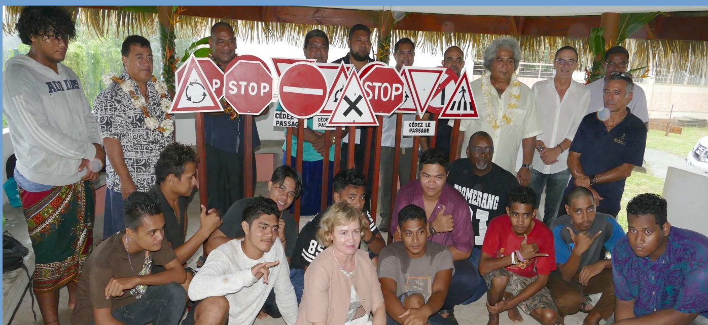
Une nouvelle étape franchie dans le cadre du projet de piste cyclable pédagogique à Wallis